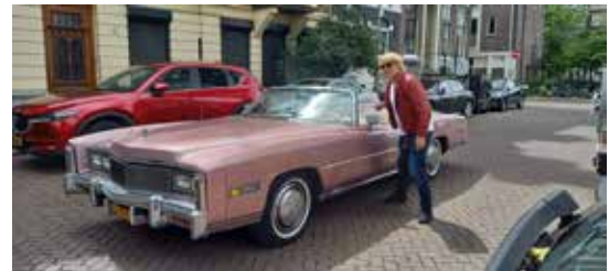
Hans Klok uitgedost als Johnny Flodder voor de promotie van Toto Casino in Amsterdam