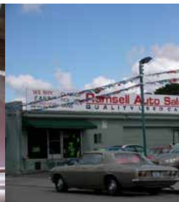
Ramsell Auto Sales in San Jose