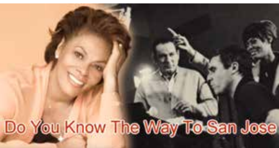
Do You Know The Way To San Jose