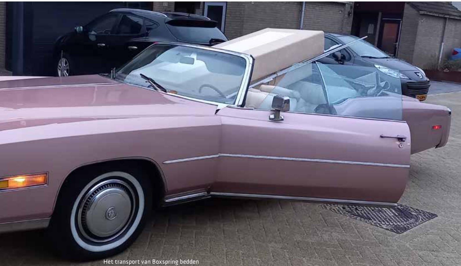
Het transport van Boxspring bedden

Detroit. Dat geeft een goed beeld van het ontstaan van de VS en de glorieertijd. Ik heb het altijd fascinerend gevonden dat de vaak arme immigranten, met name uit Europa, de VS zo groot hebben gemaakt.