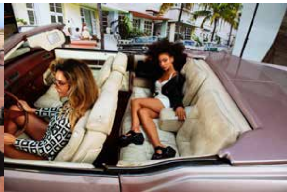
Promotie van Bronx Shoes