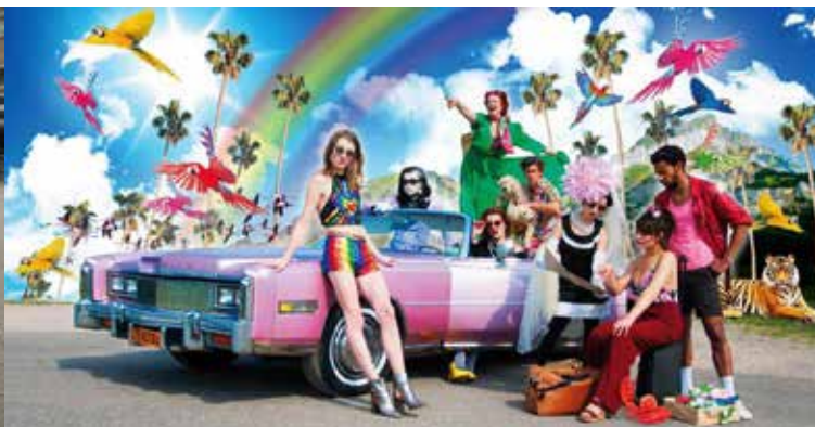
Met een kleurrijk gezelschap in Amsterdam