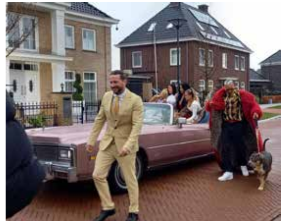
In de videoclip Hockeymeisjes met Kraantje Pappie en Bizzey