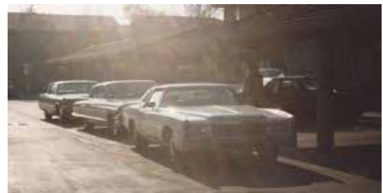
Januari 1994 in Pleasanton California