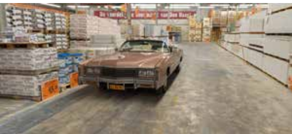
De drive in hal van Hornbach Den Haag