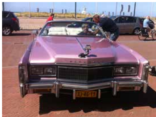
Maarten van Rossem op de boulevard van Noordwijk