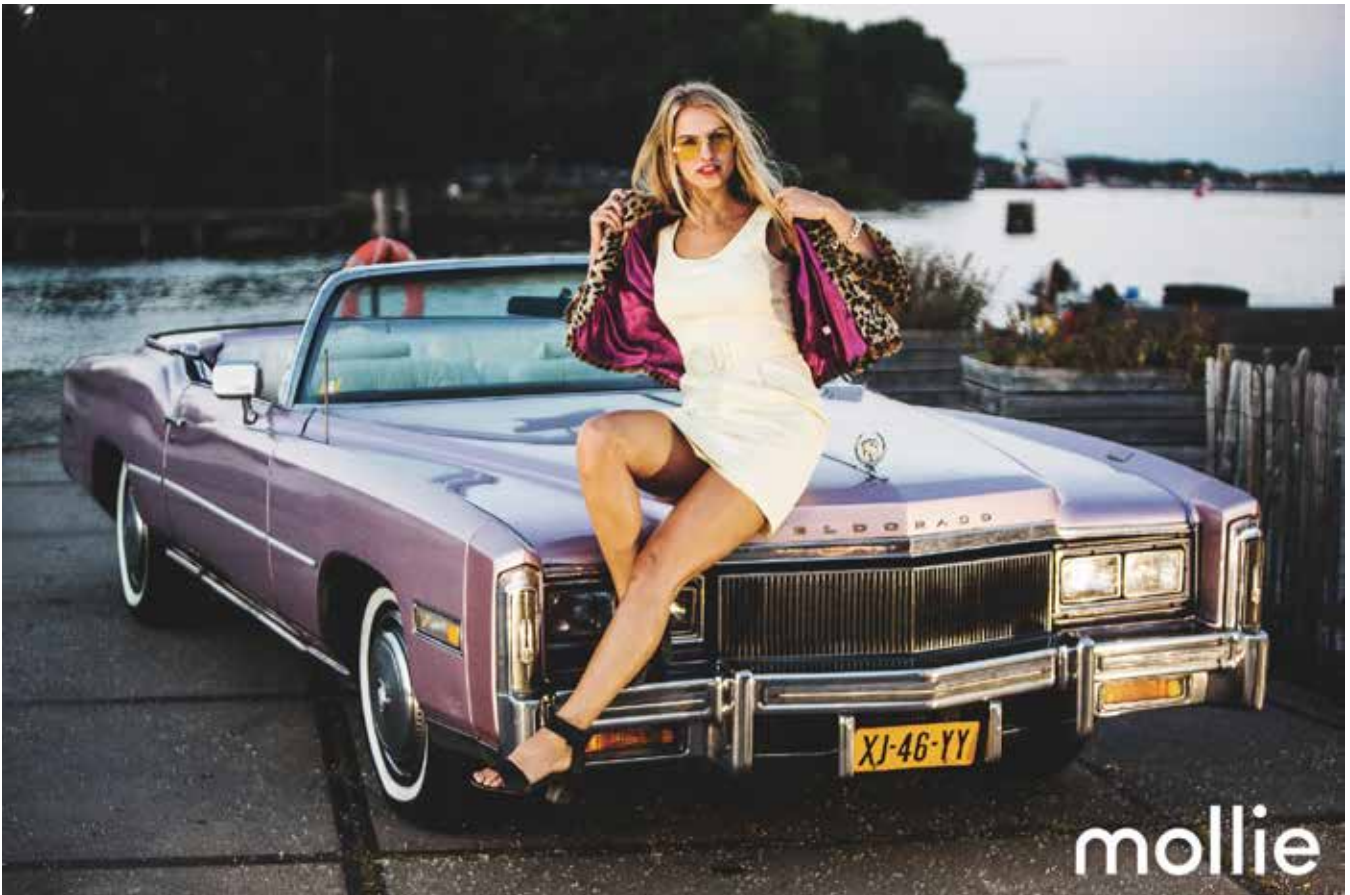
Op het personeelsfeest Molly Vice voor Molly Payments

Een mijlpaal was de 100.000 mijl die ik er mee reed en laatst werd de 200.000-ste kilometer afgelegd.