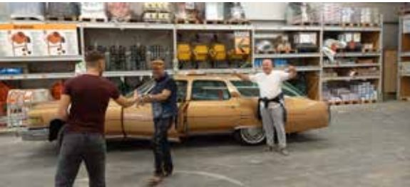
De Zuurstok nam de transporttaak over van mijn Fleetwood Station