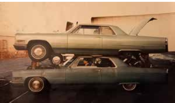
1966 Coupe de Villes klaar voor transport in een container