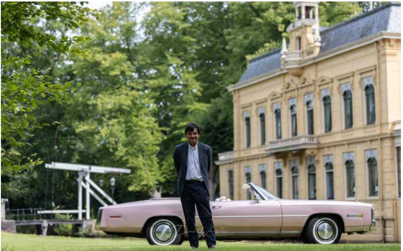
Bij Borg Nienoord in Groningen

Ik hoop dat het plezier met de Zuurstok nog vele jaren zal duren.