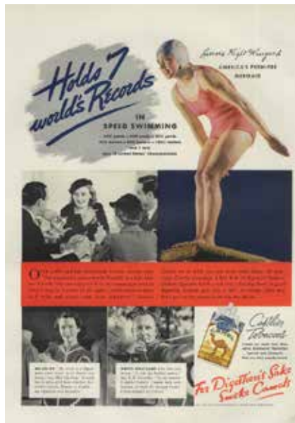
Camel advertentie uit 1937