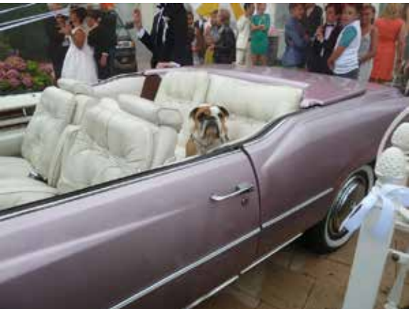
Deze hond deed mee in de film De Boskampis