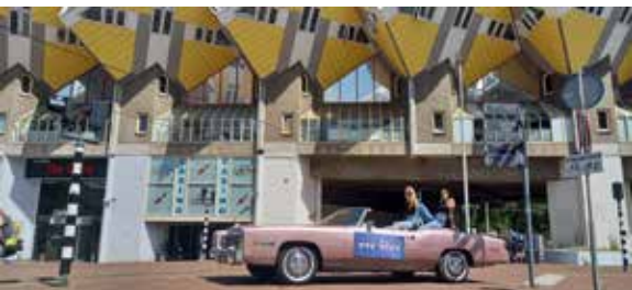
De promotie van het album Sob Rock van John Mayer