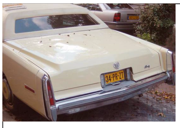
Nieuwe fillers en Nederlands kenteken.

De Pimpcar is nu bijna geheel origineel en goed opgeknapt en kan een nieuw leven beginnen in Nederland.